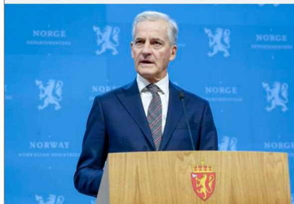
Statsminister Jonas Gahr Støre under pressekonferansen om regjeringens arbeid knyttet til krigen i Ukraina.

Med det mønsteret vi har sett så langt i Ukraina, der sivile blir rammet, mener statsminister Jonas Gahr Støre at det er dekning for å si at det foregår krigsforbrytelser.